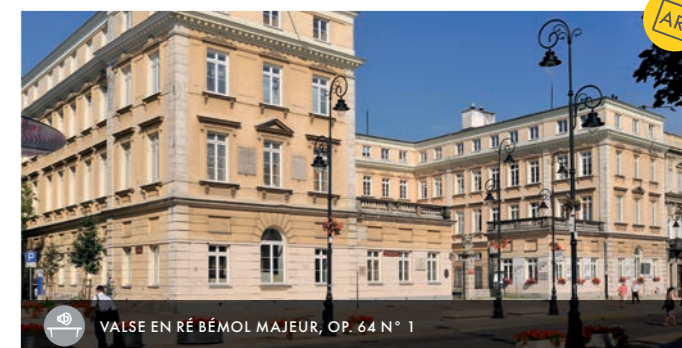
VALSE EN RÉ BÉMOL MAJEUR, OP. 64 N° 1

Dans l'annexe de ce palais se trouvait un autre appartement des Chopin, où se rencontrait toute la haute société de Varsovie. Fryderyk y a passé les dernières années avant de quitter le pays pour toujours en 1830. Il a composé ici les deux concertos considérés comme ses œuvres majeures de la période dite varsovienne.