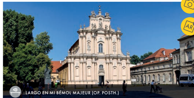
LARGO EN MI BÉMOL MAJEUR (OP. POSTH.)

Le jeune Chopin a joué de nombreuses fois de l'orgue dans cette église pendant la messe pour les élèves du Lycée de Varsovie qu'il fréquentait. Cette église du XVII ème siècle n'a pas été détruite pendant la Seconde Guerre mondiale et la majeure partie de son décor intérieur original a été préservée. Regardez bien la chaire baroque en forme de bateau, un des éléments les plus intéressants de son intérieur.