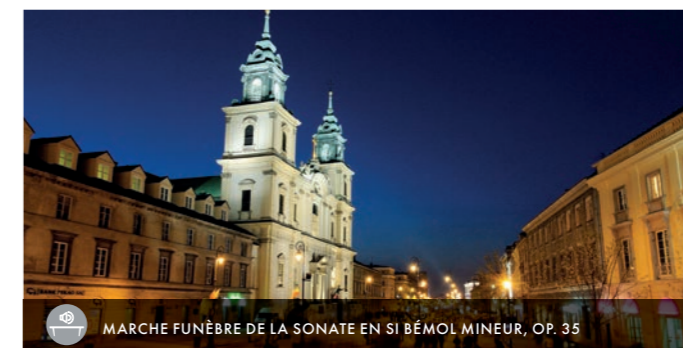
MARCHE FUNÈBRE DE LA SONATE EN SI BÉMOL MINEUR, OP. 35