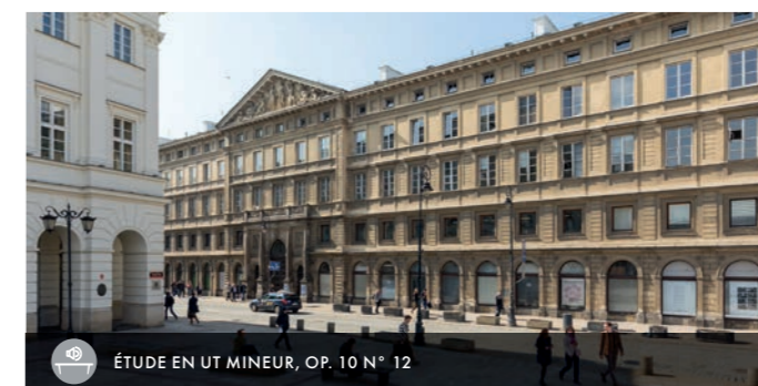
ÉTUDE EN UT MINEUR, OP. 10 N° 12

Ce bâtiment nous renvoie à l'histoire du piano à queue de Fryderyk Chopin qui se trouvait dans l'appartement de la sœur du compositeur, Izabella. En représailles à un attentat manqué contre l'envoyé du tsar, les Russes ont pillé le palais et jeté l'instrument par la fenêtre. Aujourd'hui, le palais abrite des salles de cours de l'Université de Varsovie.