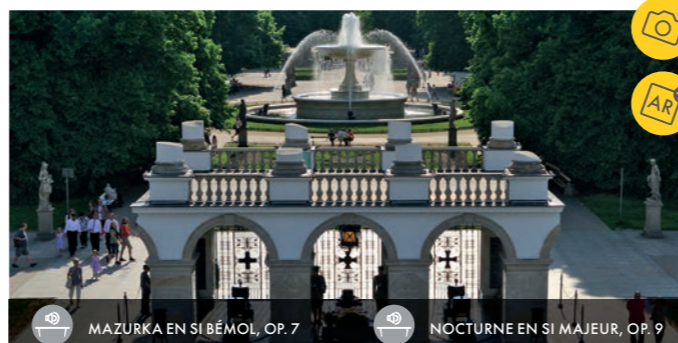
MAZURKA EN SI BÉMOL, OP. 7

Le palais de Saxe abritait le Lycée de Varsovie où le père de Fryderyk Chopin, Nicolas, avait obtenu un poste d'enseignant de français ainsi qu'un appartement de fonction. Malheureusement, le palais n'existe plus – il a été démolé pendant la Seconde Guerre mondiale. En revanche, vous pourrez visiter le jardin de Saxe, dont Fryderyk Chopin parcourait les allées il y a 200 ans.