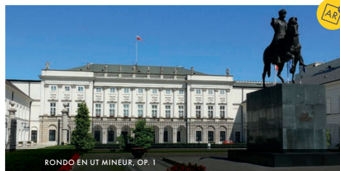
RONDO EN UT MINEUR, OP. 1

C'est dans ce palais du XVII ème siècle que Fryderyk Chopin a donné son premier concert public à l'âge de 8 ans. Ce concert a suscité un grand enthousiasme et éveillé l'intérêt de la presse de la capitale. Quand la Pologne a retrouvé son indépendance en 1918, le bâtiment est devenu le siège du premier ministre et du gouvernement et, à partir de 1994, celui du Président de la République de Pologne.