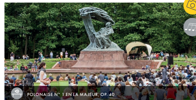
POLONAISE N° 1 EN LA MAJEUR, OP. 40

Érigée dans le Parc Łazienki pour honorer la mémoire du virtuose, elle est l'unique exemple de statue art nouveau à Varsovie. Vous pourrez y assister en plein air à des concerts de musique de Fryderyk Chopin gratuits, donnés par des pianistes renommés du monde entier. Ils ont lieu chaque dimanche, de mai à septembre, à 12h00 et à 16h00, près de la statue.