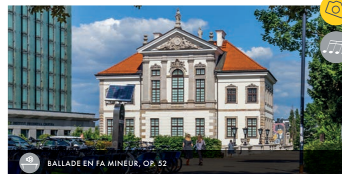
BALLADE EN FA MINEUR, OP. 52

Le musée Fryderyk Chopin se trouve dans l'ancien palais Ostrogski et il est un des rares musées biographiques multimédia en Europe. Parmi les objets qui y sont exposés, vous pourrez voir le dernier piano à queue du compositeur ainsi que des manuscrits de ses lettres et de ses compositions.