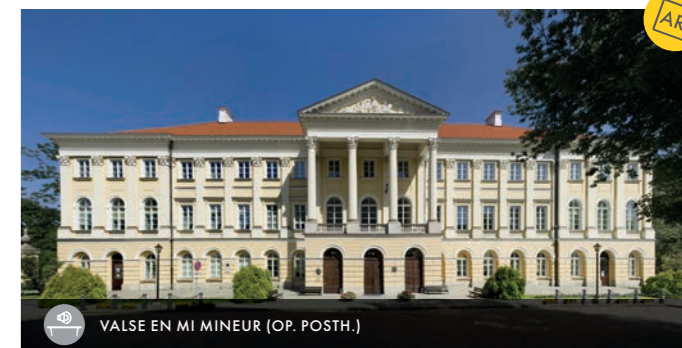
VALSE EN MI MINEUR (OP. POSTH.)

Regardez bien ce palais du XVII ème siècle dont l'architecture comprend des éléments baroques et classiques. La famille Chopin y a occupé un appartement au deuxième étage dans l'annexe gauche de l'immeuble. Fryderyk jouait et lisait souvent dans le jardin botanique avoisinant. Le palais abritait aussi le Lycée de Varsovie que fréquentait le jeune Chopin.