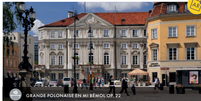
GRANDE POLONAISE EN MI BÉMOL OP. 22

C'est d'ici qu'en 1830, accompagné par ses amis, Fryderyk Chopin est parti de Varsovie, quittant la ville pour toujours, afin de se rendre à Vienne. A cette époque, le palais était le siège de la Poste dite de Saxe et de son écurie.